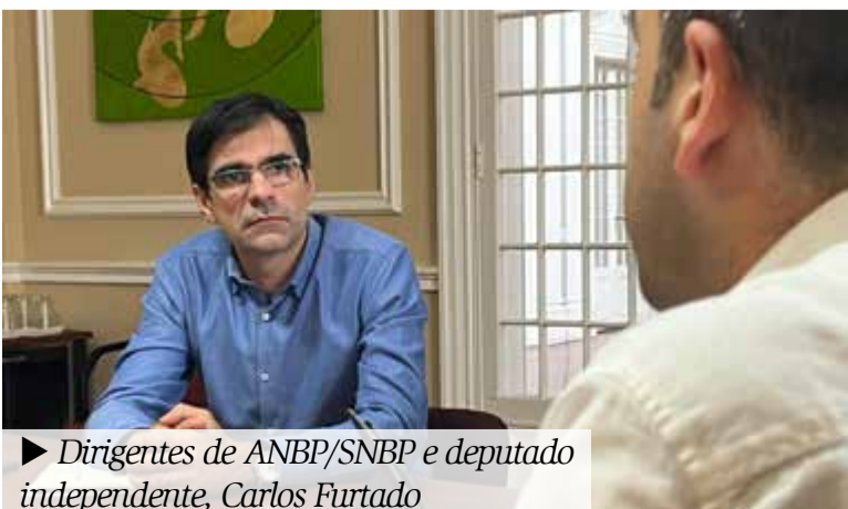
► Dirigentes de ANBP/SNBP e deputado independente, Carlos Furtado