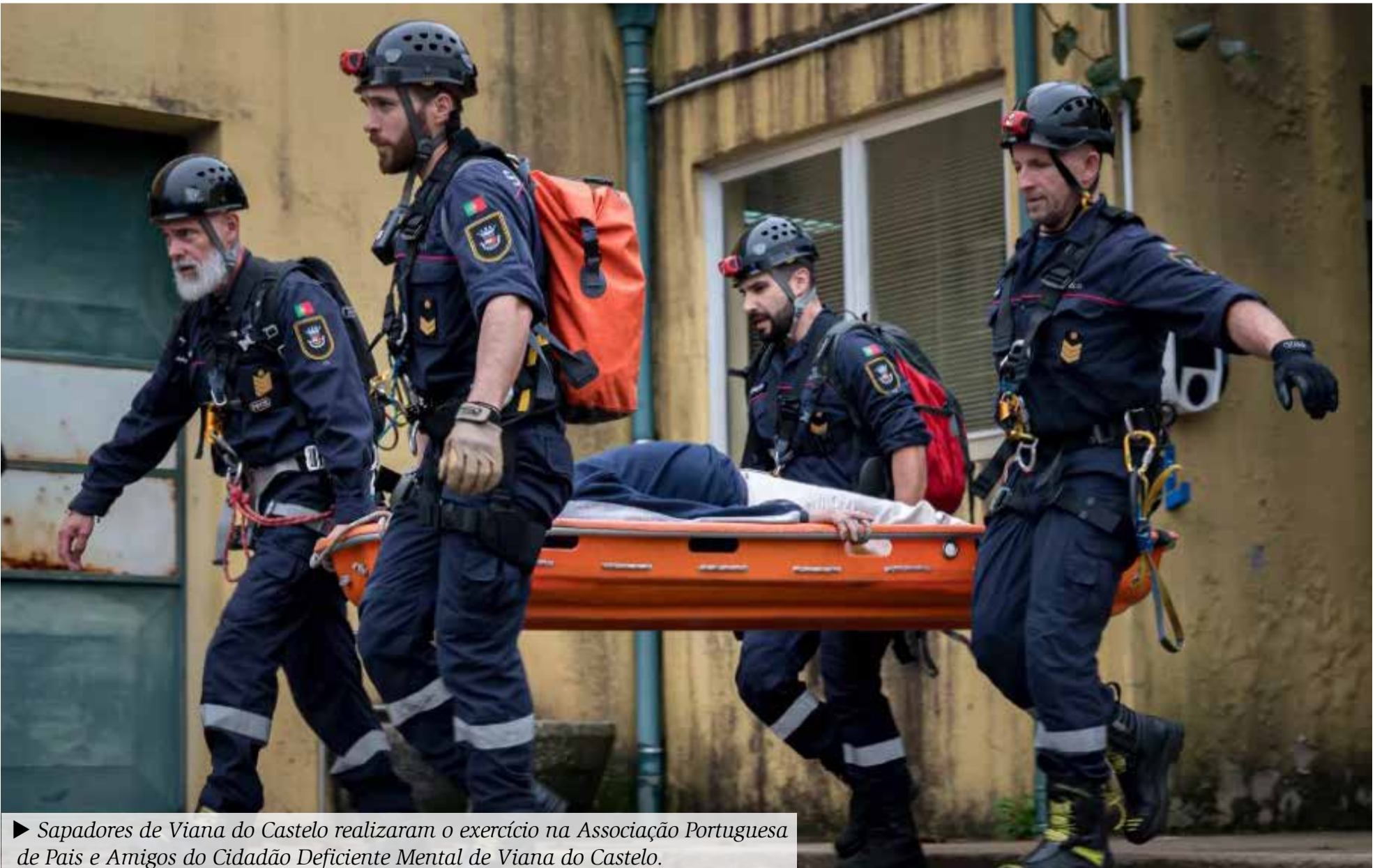
► Sapadores de Viana do Castelo realizaram o exercício na Associação Portuguesa de Pais e Amigos do Cidadão Deficiente Mental de Viana do Castelo.