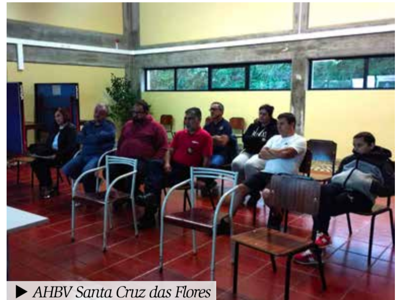
► AHBV Santa Cruz das Flores

Humanitária de Bombeiros Voluntários (AHBV) de Santa Cruz das Flores e na AHBV de Ponta Delgada, para analisar e debater questões operacionais das corporações