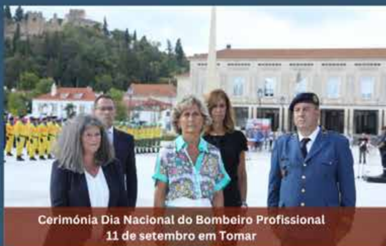
Cerimónia Dia Nacional do Bombeiro Profissional 11 de setembro em Tomar