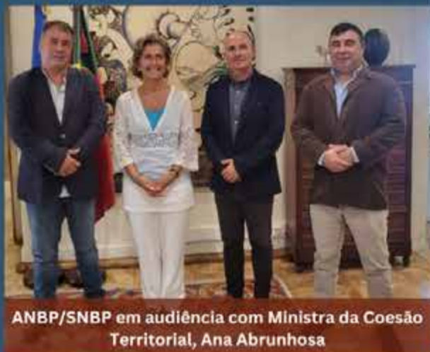
ANBP/SNBP em audiência com Ministra da Coesão Territorial, Ana Abrunhosa