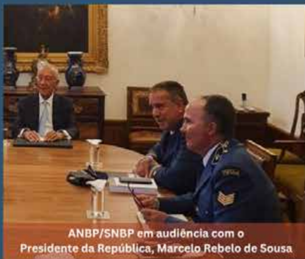
ANBP/SNBP em audiência com o Presidente da República, Marcelo Rebelo de Sousa