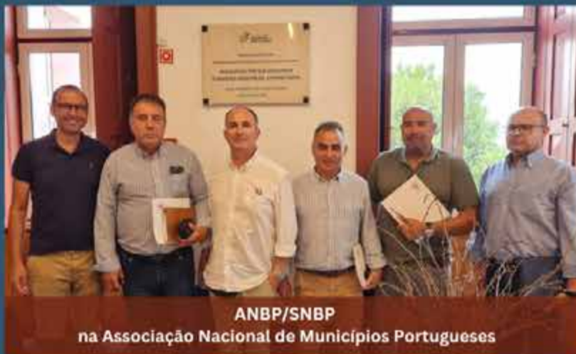
ANBP/SNBP na Associação Nacional de Municípios Portugueses