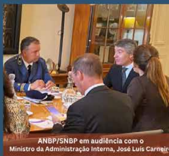
ANBP/SNBP em audiência com o Ministro da Administração Interna, José Luís Carneiro