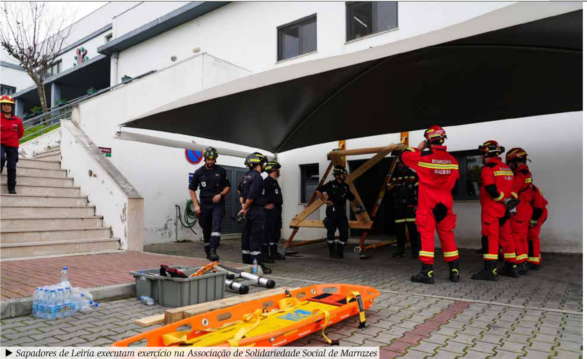
► Sapadores de Leiria executam exercício na Associação de Solidariedade Social de Marrazes