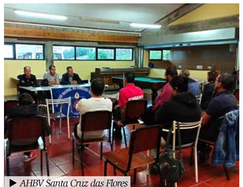
► AHBV Santa Cruz das Flores