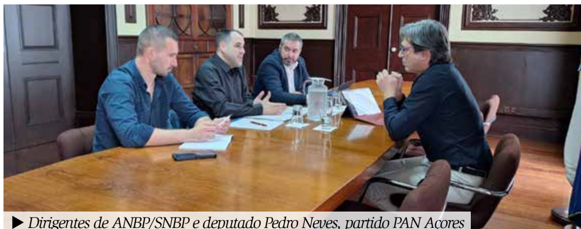
► Dirigentes de ANBP/SNBP e deputado Pedro Neves, partido PAN Açores